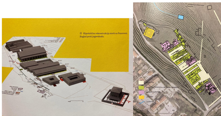
Sliki iz knjige: Osrčje Petovione: Ptuj v rimski dobi

Izgled tedanje Poetovione si natančno ne moremo predstavljati. Drugače pa velja za grič Panoram, ki je danes ostala nepozidana in je privlačna za arheološki svet. Z novimi tehnologijami so arheologi znali orisati približni izgled Panoram v tistem času, ki je takrat bila ena od mestnih četrti. Vemo da so nižje bile ulice s trgom in obrtniškimi hišami. Na griču je bilo tudi nekaj razkošnih stavb, na mestu kjer pa danes stoji vodohram pa je tedaj bilo eno izmed Poetovionskih svetišč. Nedaleč vstran, malo nižje je kasneje stala tudi zgodnjekrščanska cerkev.